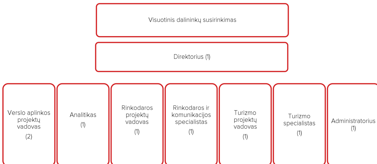
1 paveikslas. Agentūros valdymo struktūra ataskaitinių metų pabaigoje.